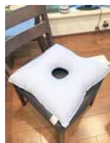
円座。事務仕事や 運転に欠かせない アイテムでした

笑っても咳をしてもお尻に響くし、痛みは取れないし、どうなるのか不安で仕方ありませんでした。