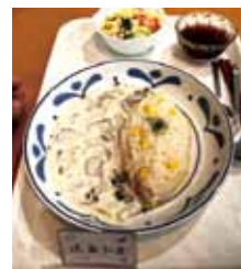
2日ぶりの食事 エビピラフ クリームソース

トイレも尿器で済ませなくてはならず、夜も痛みでなかなか寝付けなかったのが、痛み止めの錠剤をもらい、そのおかげで5時間近く休むことができました。