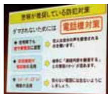
警察は電話機の入替を勧めていました