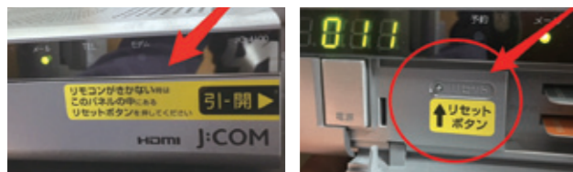
本体に親切にシールが貼ってあるチューナーもあります。蓋を開けるとリセットボタンがボールペンの先などで押します。

リモコンの電池交換をしても症状が改善されない場合、チューナー本体にあるリセットボタンを押してみてください。再起動がかり改善されることが多いです。お手元にあるチューナーによってその位置が変わりますので、設置の際に渡された説明書で場所の確認をお願いいたします。また、夜間など使用しない時はリモコンで良いので電源を切っておくことをおすすめします。