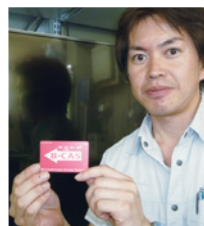
これがB-CASカードです。必ずテレビや録画機に1枚入っています。