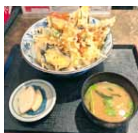
元祖塩天井ジャンボ 1,100円(税込)他