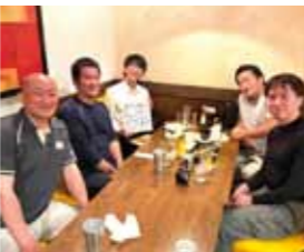
(写真左) 人手不足の中、二人の頑張りで助かりました。 (写真上) 最終日にはそれぞれのお疲れ様会を開きました。