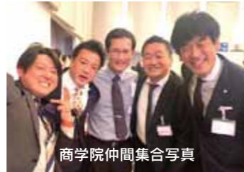
商学院仲間集合写真

今回もパナソニックグループの経営陣が揃い踏みでご出席いただいておりましたが、パナソニックホールディングス株式会社の楠見社長に